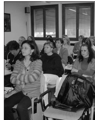
Un momento del corso

Al corso di formazione dell'Ulss 19, cui hanno partecipato complessivamente una settantina di operatori divisi nelle due giornate programmate, grande risalto è stato dato anche agli incidenti domestici che, a tutt'oggi, costituiscono per i bambini la prima causa di accesso al pronto soccorso.